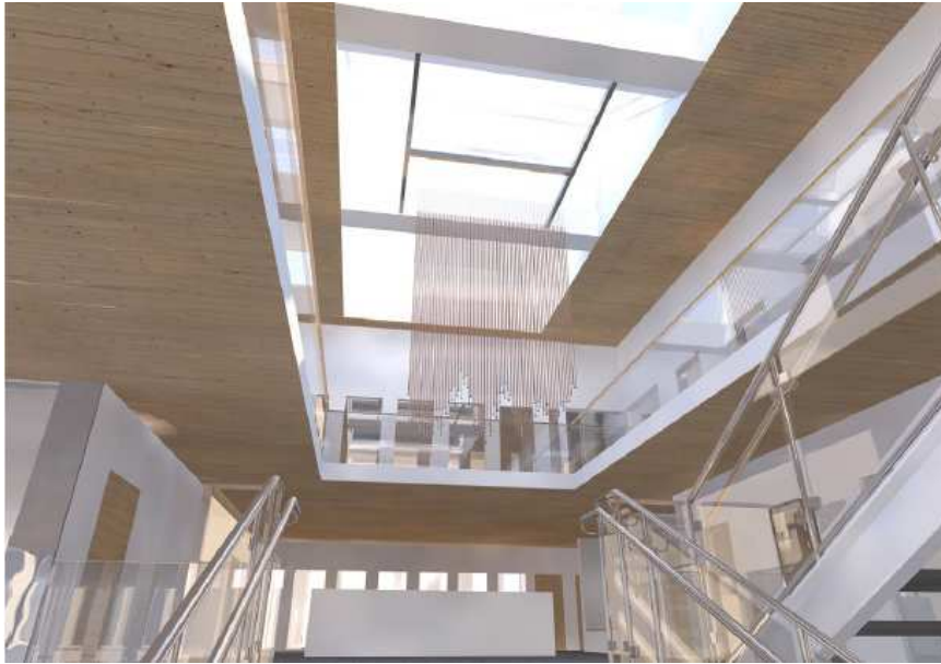
SYMPHONY FOR A RISING CITY - INTERPLAY